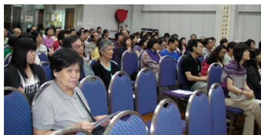
↑ → 講座