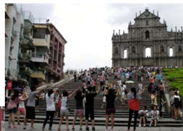
← ↑ 短宣隊佈道