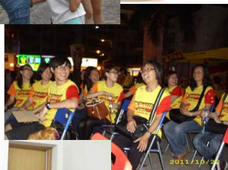
↑ 同工參與「為澳門鼓舞」花車巡遊活動