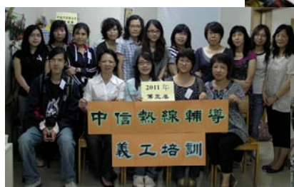
熱線義工培訓課程 ↑ →