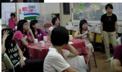
姊妹工作坊 ↑ →